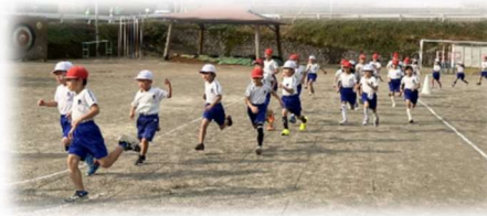
【低学年が校庭から外周へと向かう様子】