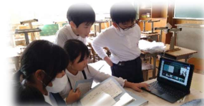
【相手の発表を聞いている様子】

鹿屋小の6年生とオンラインでつながり、ふるコミで取り組んでいること（市比野温泉のこと）を伝えました。2月にもう一度行う予定です。