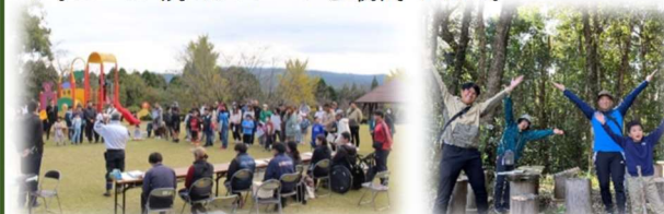
【開会式とミッションに挑んでいる様子】

樋脇中校区の3つのPTAと樋脇地区コミの共催で行われた「丸山クエスト」に多数御参加いただきありがとうございました。紅葉が美しい丸山公園で、気持ちよくハイキングできたのではないのでしょうか。ゴール後のスイーツも最高でした。