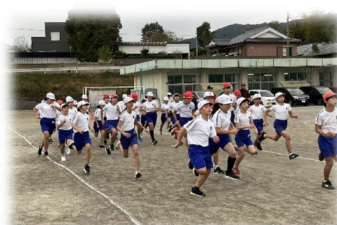
【高学年のスタート直後の様子】