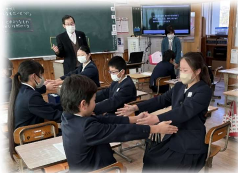
【6年生で実施した人権教室の様子】