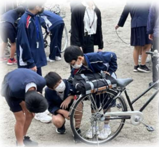
【6年生に荷ゴムのつけ方を教えている様子】