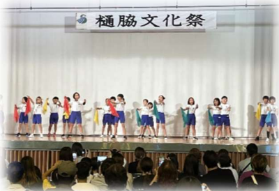
【樋脇文化祭でダンスを披露した3・4年生】