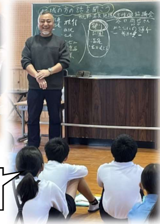
【高学年「地域の方の話を聞こう」】