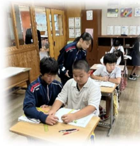
【4年生に優しく算数を教えている様子】

久しぶりに会った中学生は、とても頼もしかったです。中学校1年生のみなさん、ありがとうございました。