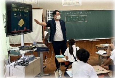
【温泉ソムリエマスター 六三四さんの授業の様子】