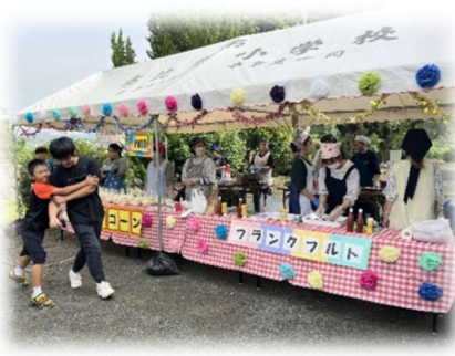
【市比野フェスタ 出店の様子】

会場の校庭や体育館では子どもたち、保護者の方々のたくさん笑顔があふれていました。今回は、市比野小学校にとってまさに「感謝の秋」となりました。