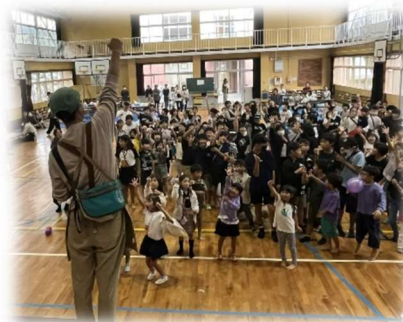
【市比野フェスタ 大いに盛り上がった「じゃんけん大会」の様子】