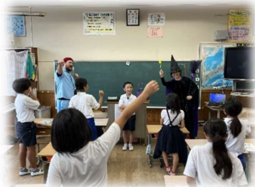
【ALT・ESTとの授業の様子 ハロウィンの仮装をしています！】