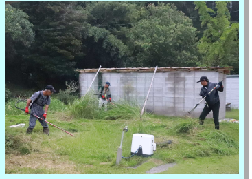
【地区ゴミの方々の協力の様子】

8月24日にP T A環境整備作業を実施し、地区ゴミの協力を得て200名を超える参加者で敷地内の環境を整えていただきました。ありがとうございました。