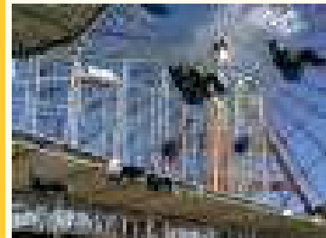
【空中ブランコはスリル満点】

はせたり、キッザニア(福岡)でいろいろな職業を体験したりと、「過去」から「未来」まで疑似体験することができた一日となりました。