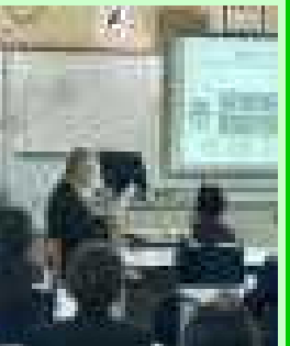
【プレゼンを効果的に使って】

12月13日(水)、メンタルケア協会の精神対話士の方々が、2年生に「生命の尊さ」について講演をしてくださいました。最後に「未来の君は、今の君の努力に感謝する」という言葉を贈られた生徒たちは、大切な命であるからこそ「どんな大人になりたいか」「どう生きるか」を深く考えることができました。