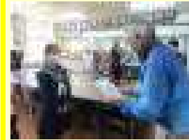
【校長室で認定証の授与】

このほか、10日(日)には樋脇地区コミュニティ協議会主催の「ぶらり散策ひわき」において、2名の生徒がボランティアガイドを務めました。資料を基に行う史跡巡りのガイドは