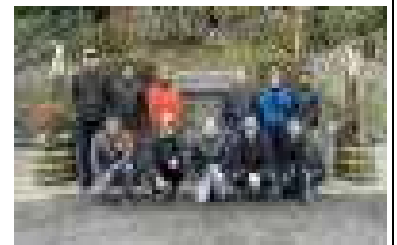
今年も丸山会の皆さんが立派な門松を作ってくださいました。いい正月が迎えられそうです。