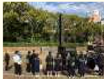
【原爆投下時の爆心地に立つ生徒】

一日目は長崎。原爆資料館を見学した後、実際に被爆された方の講話を聞くという貴重な体験をすることで、改めて原爆の恐ろしさや平和について深く考える時間を過ごしました。