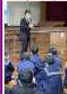
【真剣に聞く生徒たち】

12月11日(月)、宮之城中学校の M 先生にお越しいただき、人権学習を行いました。先生は、映画『もののけ姫』を通して、差別の起こりについて分かりやすくお話くださいました。