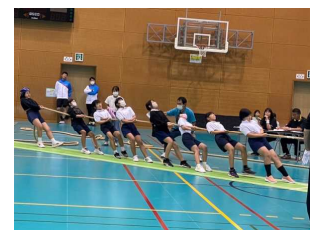
【綱引き大会の様子】

翌日登校した児童の中には「頑張りすぎて全身筋肉痛です。」と伝えて来たり、湿布を貼って登校したりする子供たちもいましたが、充実感に満たされた表情をしていました。