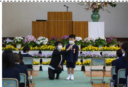
[あいさつは、緊張するなあ。]