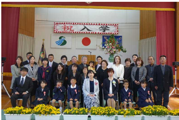
[みんなで記念撮影。1年生のスタートです。]

4/6(月)は、入学式が挙行されました。ぴかぴかの1年生、早く学校に慣れて、「あったかサン」の仲間入りをしてほしいものです。