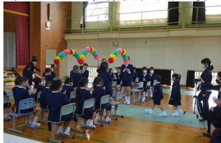
[どきどきの入場です。]