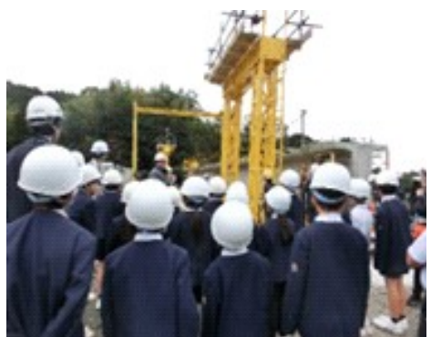
【飯母橋建設現場の見学】

と飯母地区を結ぶ樋脇川に架かる橋です。昭和、平成、令和の時代の長きにわたり地域の道路として生活を支えてきました。老朽化に伴う架替え工事は、約2年前から始まっており、今回、大きな橋桁を設置する日に合わせて見学に行くことができました。見学では、橋桁を動かして設置する様子を見るだけでなく、橋の建設に使われるドローンやVR技術など最新技術を用いた説明を受けたり、高所作業車の搭乗体験を行ったりすることができました。現代の建築や土木技術を学ぶ貴重な機会であるとともに、子どもたちにふるさとの歴史について考えるきっかけとなったことと思います。飯母橋の架け替え工事見学で得た学びは、本校が目指す「ふるさとを大切に思う心の育成」に繋がるものです。自分の住む地域の歴史や文化を知り、それを支える人々の活動に触れることは、郷土への誇りと愛着を深めてくれることでしょう。この「ふるさとを大切に思う心」は将来、子どもたちがどのような道に進むことになっても、自分を育ててくれた地域に貢献したい、守りたいという主体的な行動へ発展することと信じています。