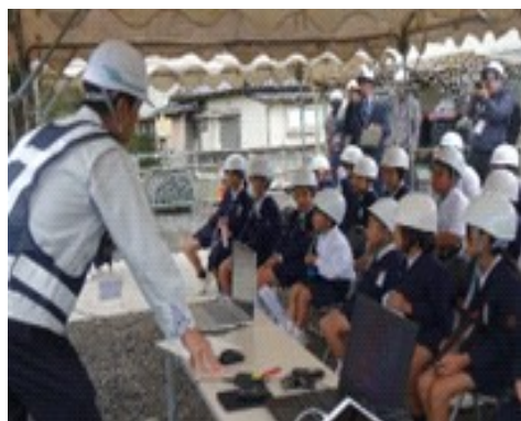
【飯母橋建設の説明】