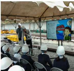
【橋架替工事の説明】

11月11日(火)、子どもたちは地元の飯母橋の架替工事を見学し、高所作業車やドローンの動きに興味津々。VRゴーグルで工事の様子を体験し、橋の仕組みや役割について説明を聞きました。普段見られない現場に触れ、学びに満ちた時間となりました。