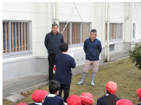
【森林組合の方への御礼】

三学期から校区外の転校生を1名迎え、児童数が昨年度と同じ27名になりました。入学予定数が年々減少する傾向ですが、10年後、30年後、50年後も平佐東小学校から子供たちの元気な声が聞こえてくることを願いながら、その時の卒業式や入学式を桜の花が盛大に祝ってくれることを思い浮かべています。