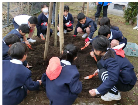
【苗木の植樹の様子】