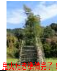
鬼火たき準備完了!