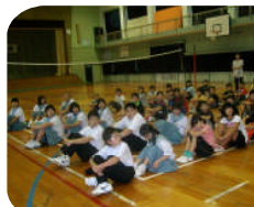
【オリエンテーション】

6月20日(月)、今年度第1回目の中期交流学習が海星中で行われました。1学期に中期交流学習(コミュニケーション科)が行われるのは初めてです。「下甌の歴史・文化について調べ・理解し、情報発信しよう!」というテーマに4つのサブテーマを設け、それに学校の枠を解いた4グループで取り組むというこれまでにない画期的な手法で学習を進めています。