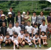
【親子グランドゴルフ】

また、5・6年の算数では電子黒板と大画面テレビの2つを活用した授業が行われました。残念ながら、本校には電子黒板が1台しかありませんが、その1台をフルに活用して授業を行っています。