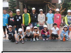
少年自然の家にて

1日目の11日(火)の朝は、バスやシーホークを乗り継いで串木野駅付近のショッピングセンターまで行き、昼食と買い物をしました。みんなフードコートで思い思いのものを食べた後、キャラクターグッズ等目を輝かせて買っていました。その後、JR、タクシーを乗り継いで自然の家へ。自然の家では「泊まる」だけでしたが、入所式で在所中の生活態度について改めて考えることができました。そして、消灯時刻には見事に寝入った?ようでした。